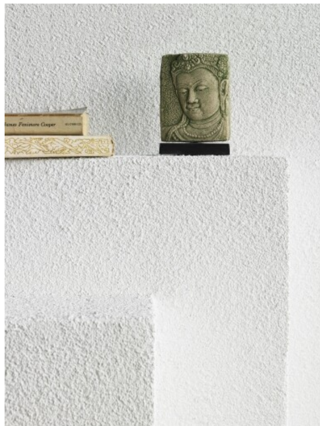
Fireplaces and walls