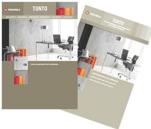
Colour card and brochure