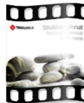
TV-ads, infomercial, video clips