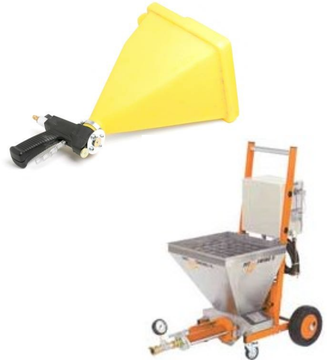
Funnel spray-gun and plaster pump